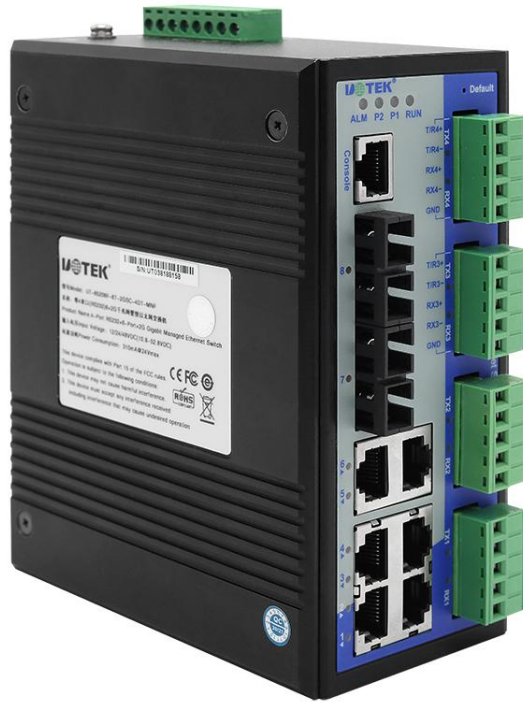
UT-65208F系列 带串口网管型以太网交换机